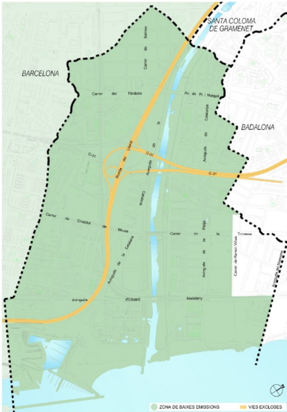
Plànol específic de la porció del terme municipal de Sant Adrià de Besòs inclòs en l'àmbit Rondes de Barcelona.